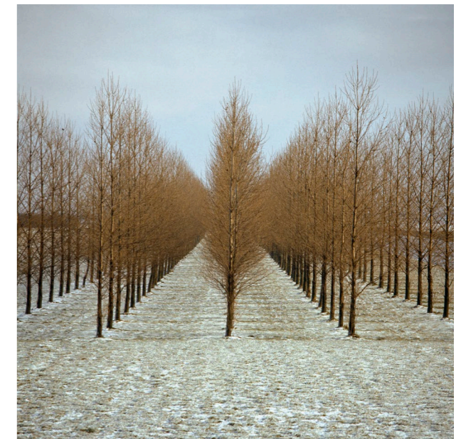
Ger Dekkers, Wood near Biddinghuizen , 1972

De tentoonstelling is te zien tot en met 23 augustus.